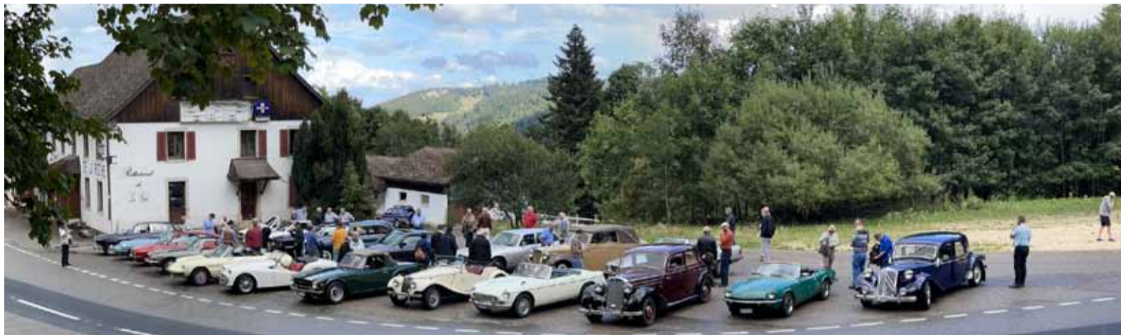
Die ganze Oldtimerschar schön aufgereiht mit fast allen Teilnehmern auf dem Bild...

Loris Sauter, Gesellschaftsbruder E.E. Gesellschaft zum Hären