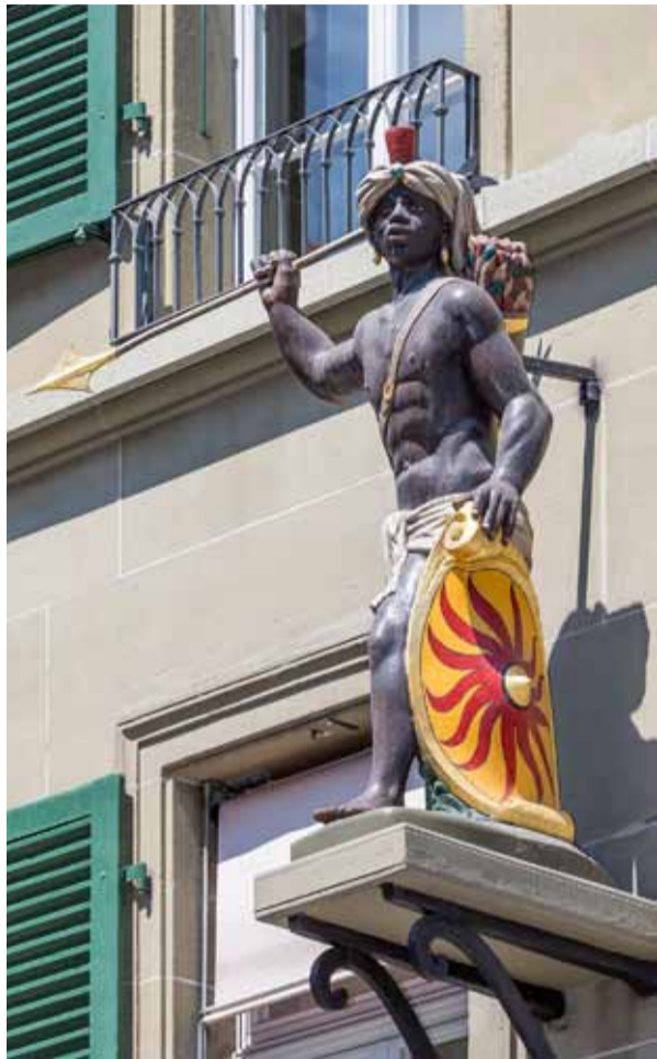
Skulptur am Zunftshaus zum Mohren

Zum Jahreswechsel 2022/2023 hat die Zunft zum Mohren in Bern aus aktuellem Anlass wieder ihren früheren Namen Zunft zur Schneidern angenommen.