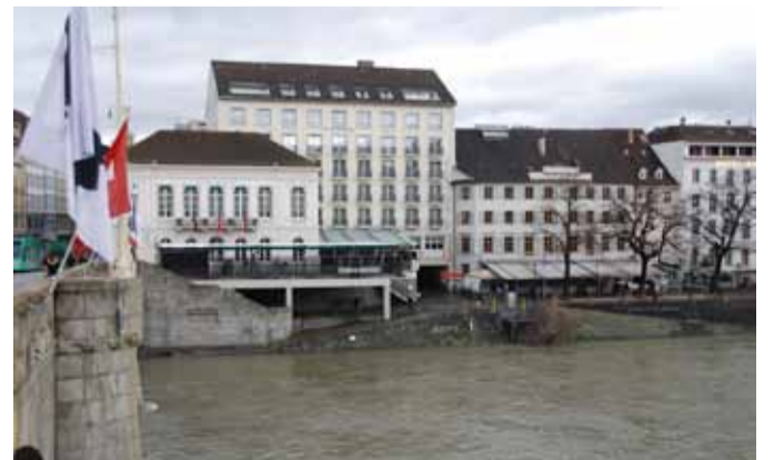
Die heutige Ansicht dieser Gebäude (Foto: hen)

Quellennachweis: Historisches Festbuch, 1892, Topographie Kleinbasel, von Rudolf Wackernagel