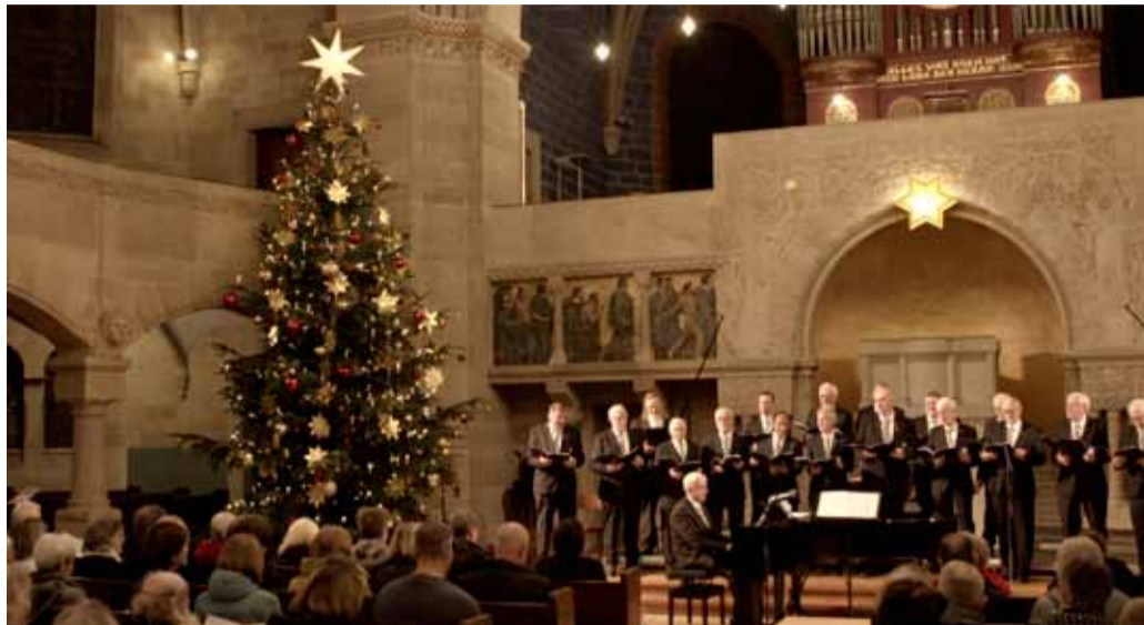
Adventskonzert der Basler Zünfte in der Pauluskirche.

Das musikalische Basler Zunftwesen besteht nicht nur aus Pfeifern und Tambouren, es gibt auch noch Sänger in allen Tonlagen und Metall-Harmonien. Diese Vielfalt gilt es für einmal zu dokumentieren. Dies in einem fernsehtauglichen Video.