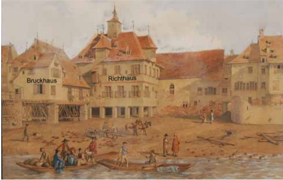
Das Richthaus und das Bruckhaus am Kleinbasler Brückenkopf der Mittleren Rheinbrücke. Gemalt von C. Guise, 1836. Das Bild ist im Besitz der Drei Ehrengesellschaften Kleinbasels.

Bis zum Zusammenschluss mit Grossbasel im Jahre 1392 bildete das Kleinbasel eine selbstständige Stadtgemeinde, die am Brückenkopf seit 1289 ein eigenes Rathaus besass. Im Jahr 1392 wurde der Rat im Grossbasel ansässig und das Rathaus verlor seine Bestimmung. Das Rathaus bekam eine neue Bestimmung und wurde zum Richthaus. Es stand dem Schultheissengericht, dem Flurgericht, der Rheininspektion und dem Wachtkollegium zur Verfügung. Ebenso wurden am Schwörtag die Eide im Richthaus abgelegt.