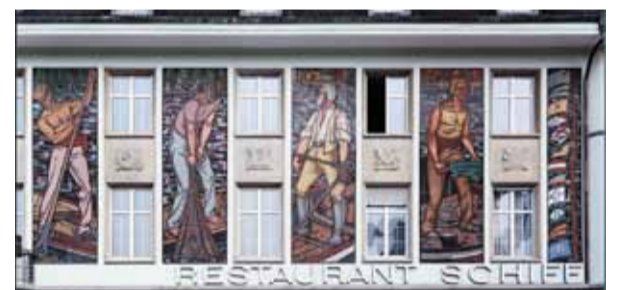
Rest. Schiff

er bis zu seinem Tod 1950 bekleidete. In dieser Zeit entwarf er nicht nur die Fischern-Zunftfahne, das Zunftabzeichen sowie die Aufnahmeurkunde. Ausserdem kam die Zunft jeweils in den Genuss besonders origineller Menükarten bei den Zunftessen.