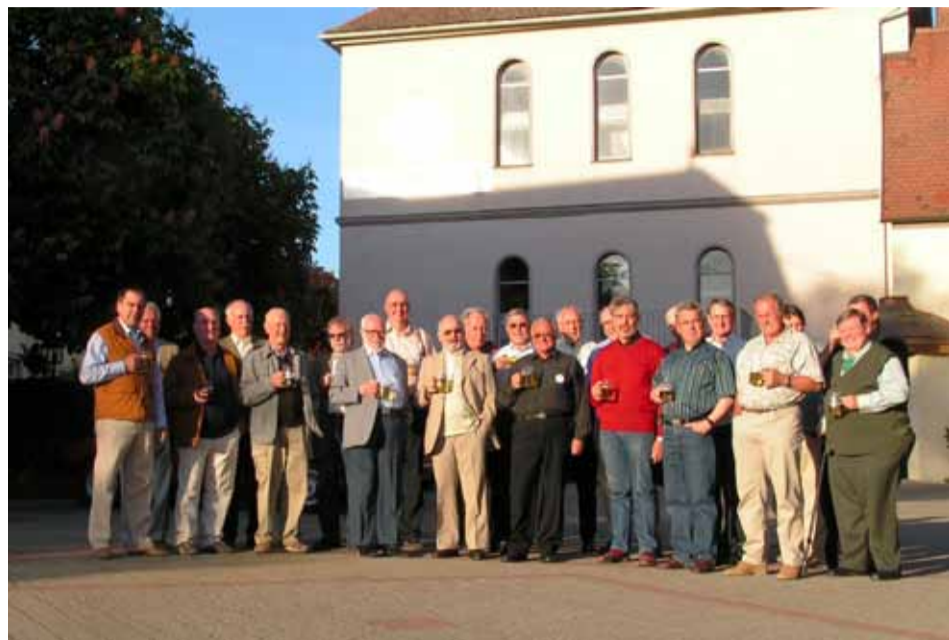
Die Sänger vom Rebleutenchor beim verdienten Bier.

Der Chor der E. Zunft zu Rebleuten wurde 1940 urkundlich das erste Mal erwähnt. Er hat einige geschichtsträchtige Auftritte absolviert.