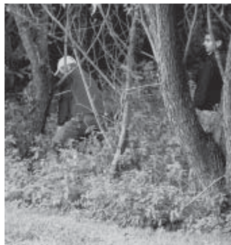
Auch das kam vor: Rettungsversuch eines missglückten Schlagens ins «Gjätt».

Sämtliche Zunftgolfer sind bei kühler Witterung, dafür aber ohne Regenschauer wieder trocken und gesund ins Clubhaus zurückgekehrt. Trotz ergiebiger Regenfälle am Vortag präsentierte sich die Golfanlage in einem hervorragenden Zustande. Bei Loch 10 wurde eine schmackhafte Zwischenverpflegung abgegeben, dies zur Stärkung für die restlichen neun Löcher. An dieser Stelle ein herzliches