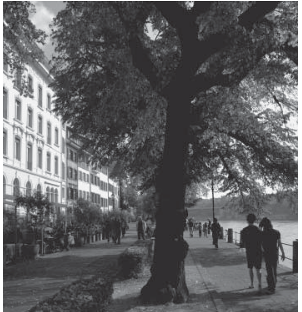
Die Kleinbasler Riviera ist richtig sonnenverwöhnt und bietet erst noch den schönsten Ausblick auf die wundervolle Kulisse der «grossen Stadt», meint der Vorsitzende Meister der E. Zünfte und E. Gesellschaften der Stadt Basel ...

Vielleicht sollten wir einmal eine solche Führung mitmachen. Es würde unserem Selbstwertgefühl sicher nicht schaden und uns wieder bewusst machen, dass wir uns als Zünfte und Gesellschaften vermehrt in die Kultur und in das Gemeinwesen