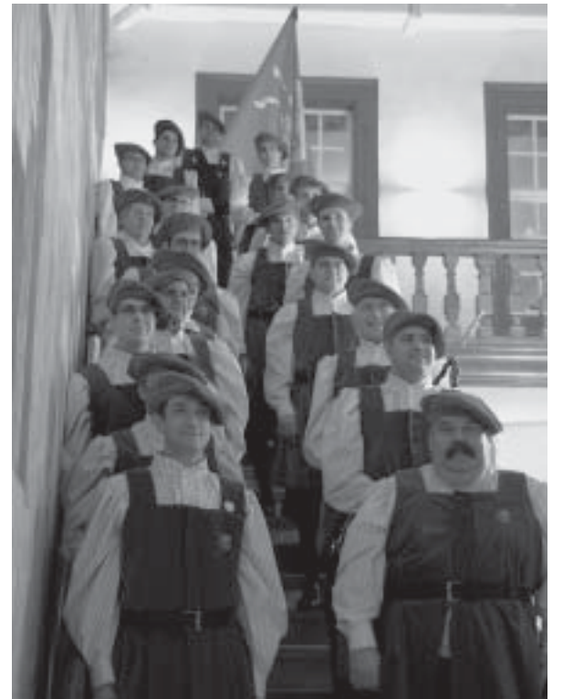
... und das Original

deten. Ein generöser Zustupf der Metzgerstiftung des Metzgermeistervers Basler und der Hermann Herzog Stiftung, die der E. Zunft zu Metzgern besonders gut gesinnt sind, sorgte schliesslich dafür, dass der Auftrag für die neue Uniform des Zunftspiels erteilt werden konnte.