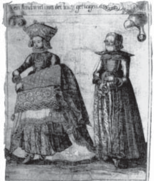
«ein Kind wirt von der tauff getragen.»