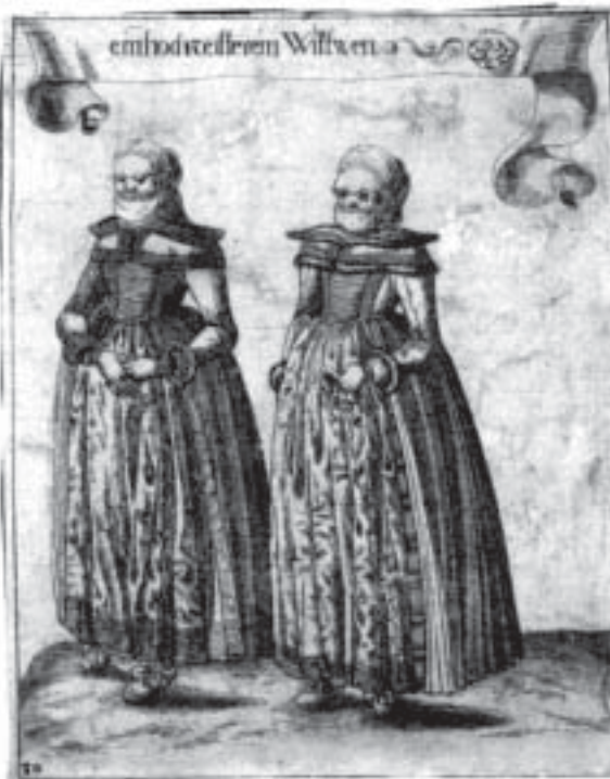
«ein hochzeitereim wittwen», also eine Witwe als Braut

Die Karriere eines ‚Secondo‘ in der frühneuzeitlichen Zunftstadt unterscheidet sich vom traditionellen Aufstieg durch spärliche Überlieferung, Quereinstieg, Überspringen mindestens eines sozialen Standes, markant geringeres Beziehungsgeflecht und grössere Anfälligkeit auf sozioökonomische Barrieren. Griff eine gesamtfamiliäre Strategie, war die langfristige Etablierung machbar. Band hingegen der Einzelaufstieg die Kräfte, hielt sich das Geschlecht nur schwer im erreichten Stand. Die städtische Obrigkeit liess ihre soziale Durchmischung zu, wenn die ‚Se-